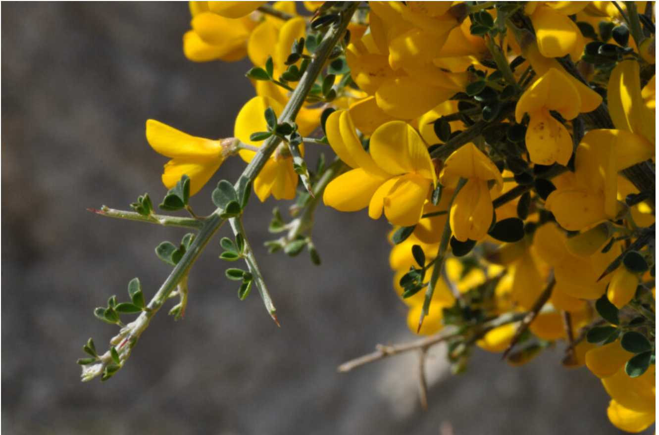
Calicotome villosa