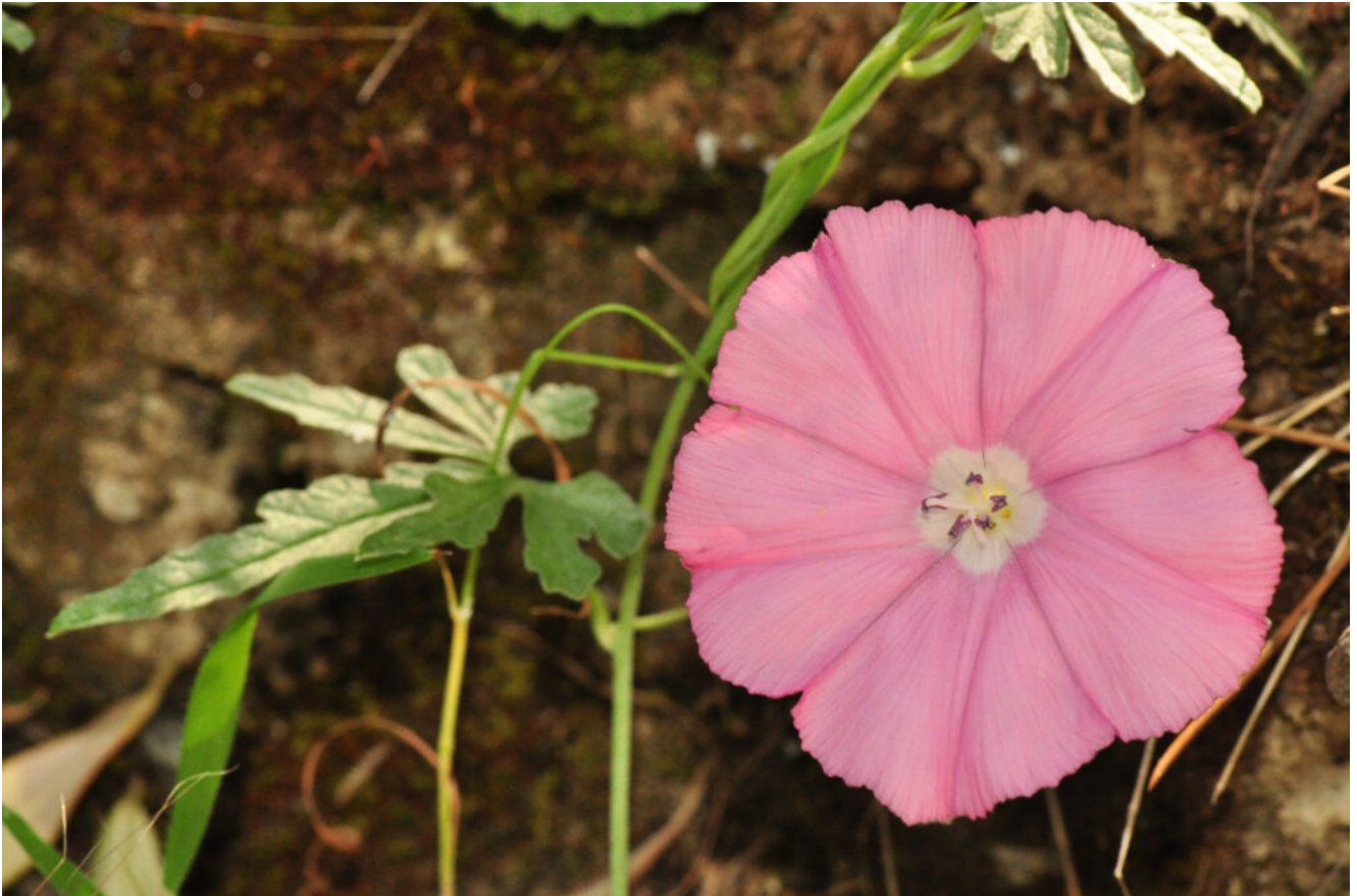
Convolvulus elegantissimus