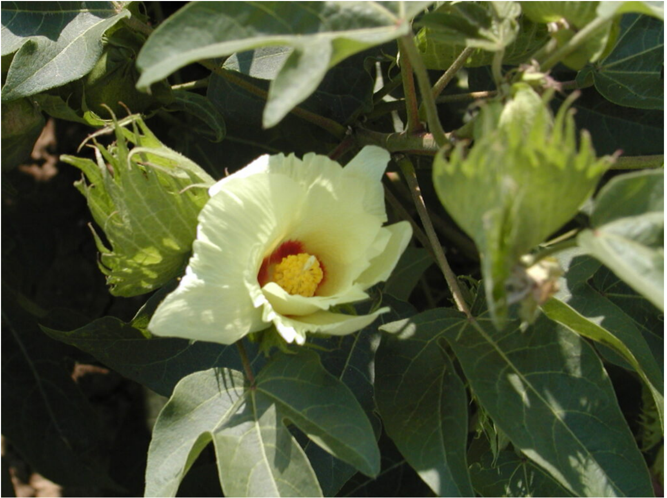
Gossypium hirsutum