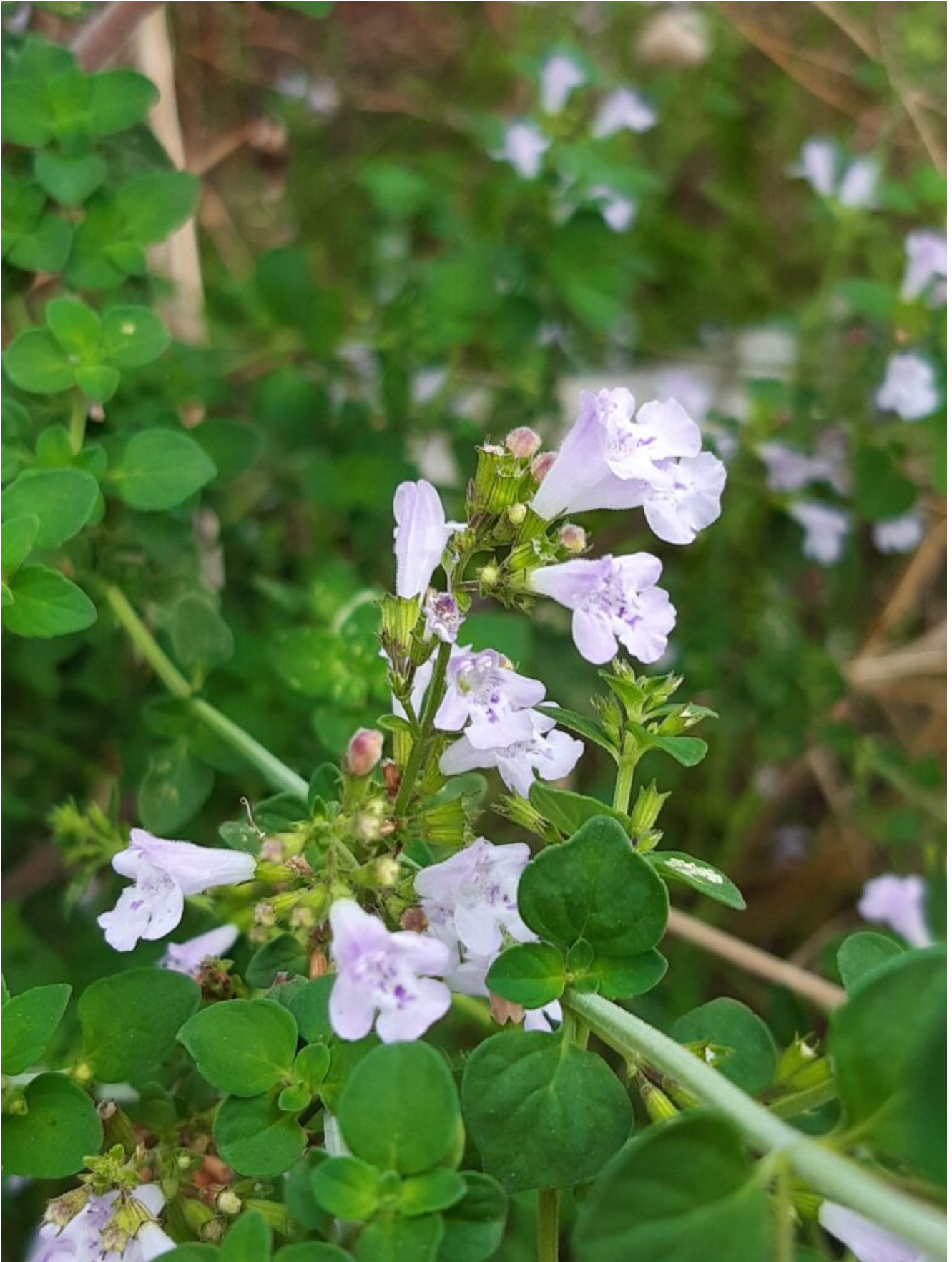
Mentha pulegium