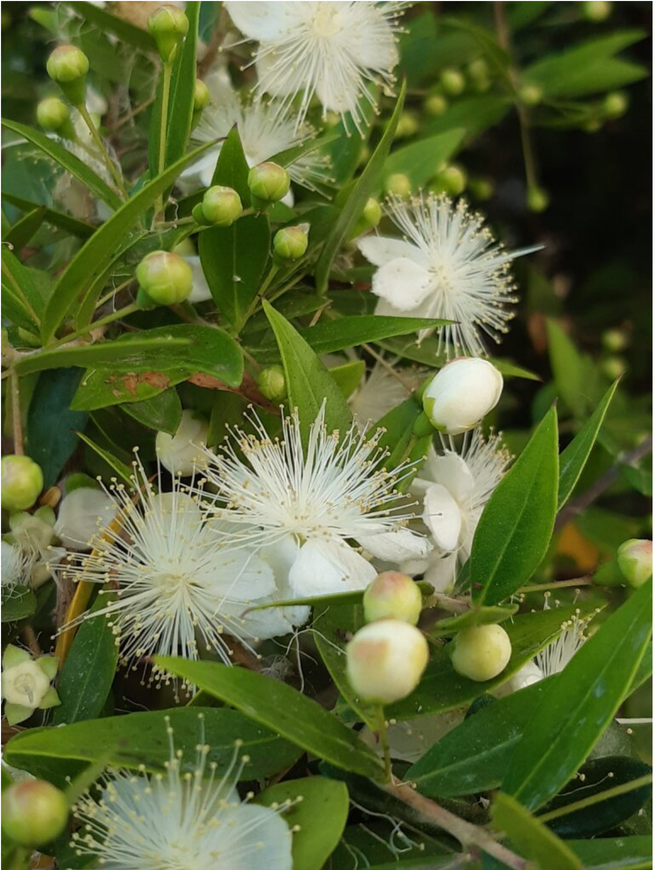
Myrtus communis