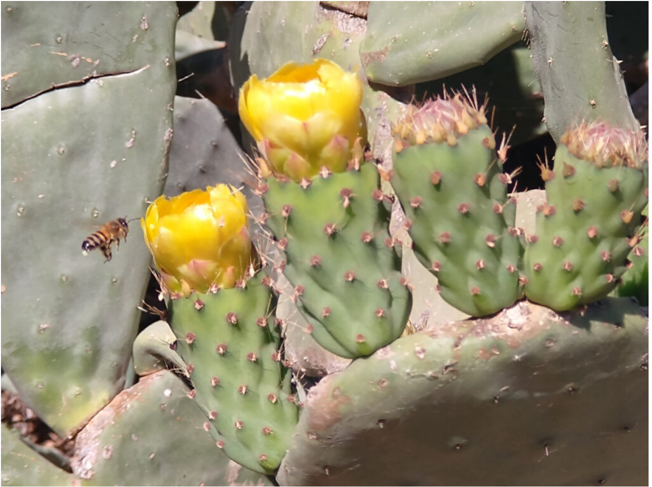
Opuntia ficus-indica