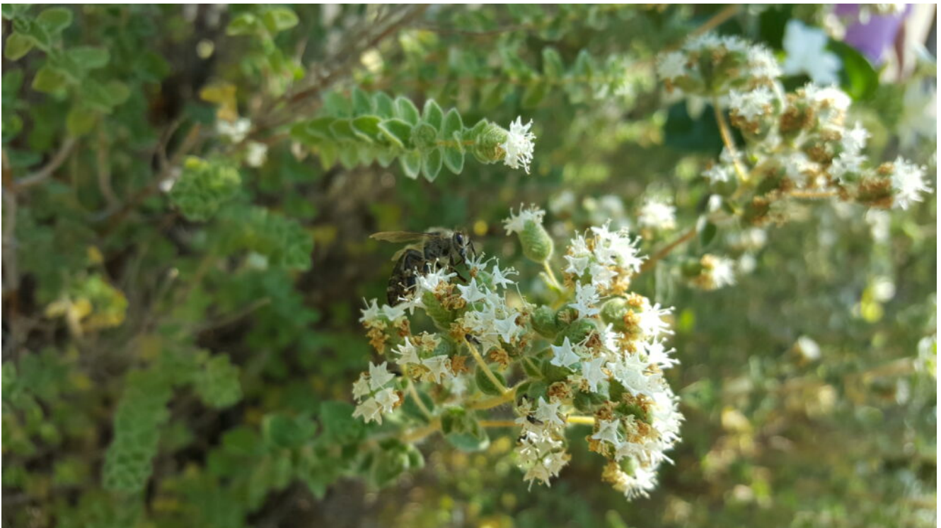
Origanum onites