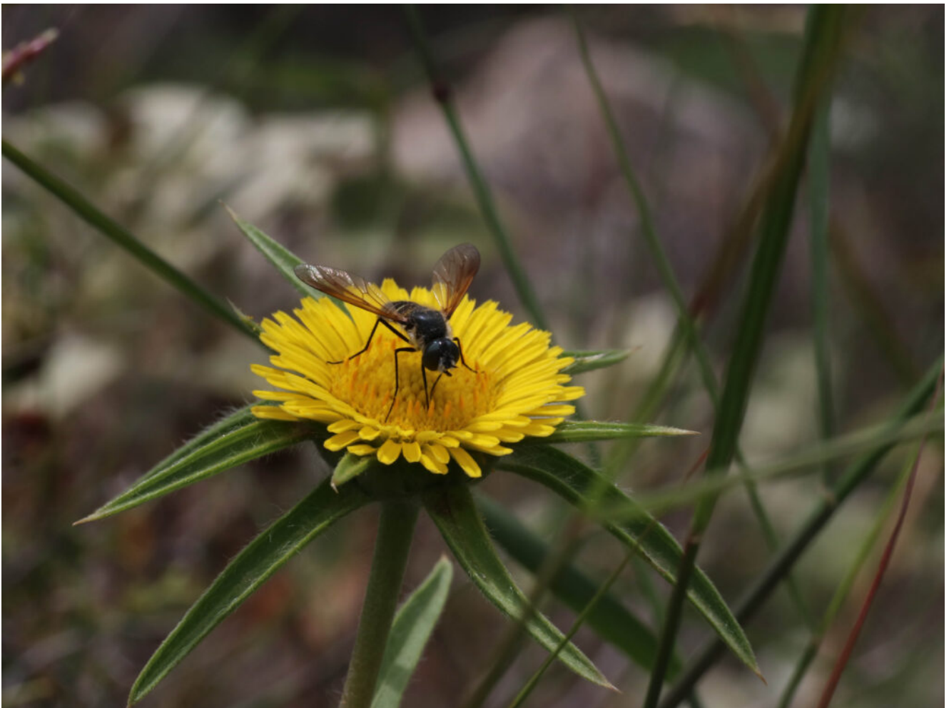
Pallenis spinosa