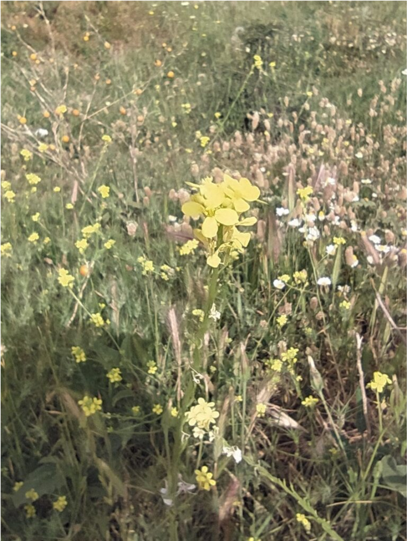
Sisymbrium irio